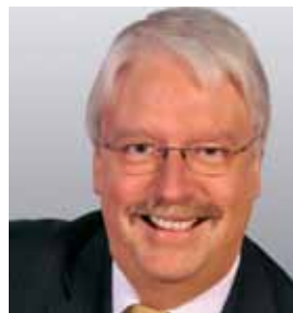
Volker Bouffier Hessischer Ministerpräsident

Liebe Filmfreundinnen, liebe Filmfreunde, sehr geehrte Gäste des Festivals,